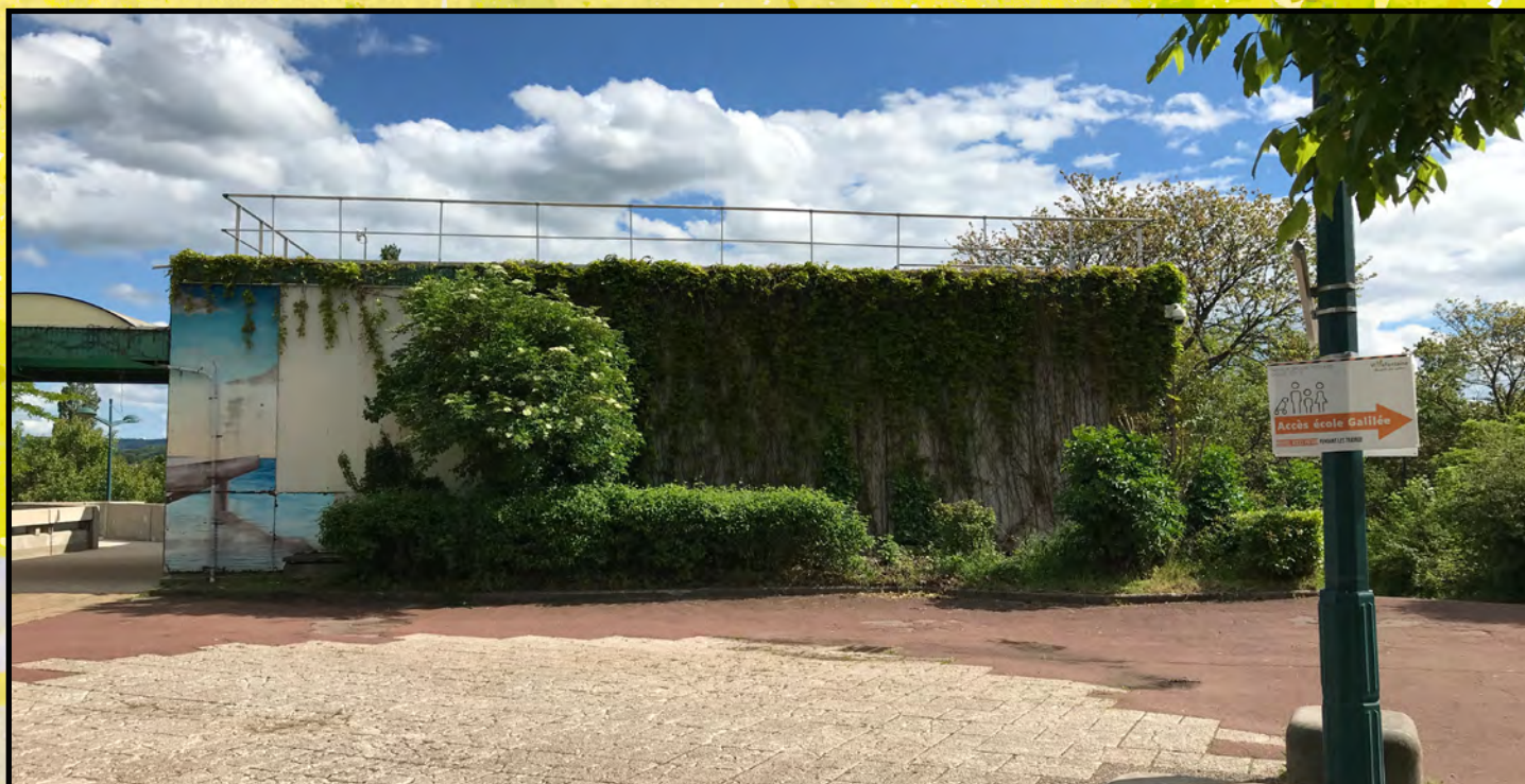
LE MUR DE LA COLLAB' / PLACE NELSON MANDELA